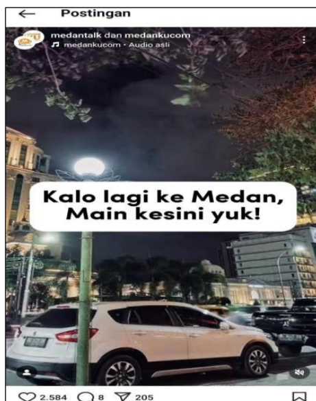
Gambar 3. Postingan promosi budaya dan kegiatan lokal

Hal ini terlihat dari tingginya interaksi di kolom komentar, di mana para pengikut tidak hanya memberikan tanggapan positif, tetapi juga berbagi pengalaman pribadi terkait unggahan tersebut. Dengan demikian, MedanTalk tidak hanya menjadi media informasi, tetapi juga platform yang memperkuat identitas budaya lokal melalui narasi positif dan kreatif. Dengan potensi yang besar, jurnalisme digital dapat terus dikembangkan sebagai alat utama dalam promosi budaya dan kegiatan lokal. Inovasi seperti penggunaan teknologi realitas virtual (VR) untuk menampilkan destinasi budaya atau gamifikasi dalam mempelajari tradisi lokal merupakan beberapa langkah yang dapat diambil untuk meningkatkan efektivitas media digital dalam mempromosikan budaya (Sutrisno, 2021).