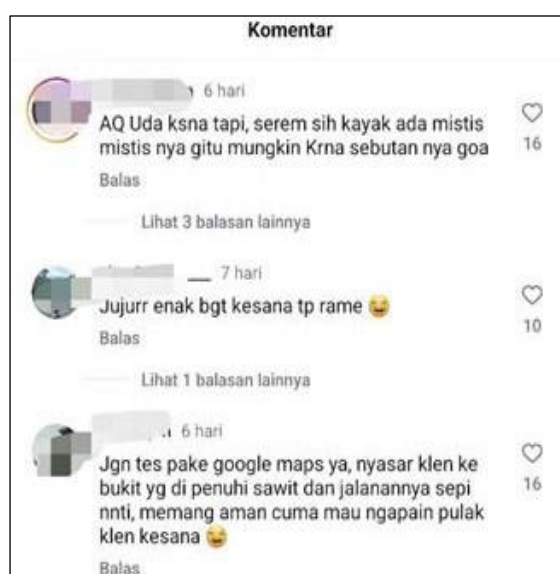
Gambar 2. Interaksi masyarakat di postingan Medantalk

Pada kategori promosi budaya dan kegiatan lokal, sekitar 20% unggahan difokuskan pada acara-acara seperti festival kuliner, pertunjukan seni, dan tradisi budaya khas Medan. Liputan langsung tentang festival budaya melalui Instagram atau Facebook memungkinkan audiens yang tidak dapat hadir secara fisik tetap merasakan atmosfer acara tersebut (Wahyuni & Santoso, 2020). Akun MedanTalk menggunakan bahasa yang santai namun akrab, sering kali menyertakan istilah lokal seperti "kali" atau "betulnya," yang menciptakan kedekatan emosional dengan para pengikutnya.