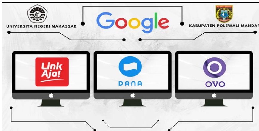
Gambar 4. Aplikasi sistem pembayaran non tunai atau digital payment

Serta dipaparkan juga terkait media untuk melakukan transaksi non-tunai/ digital payment apabila konsumen menginginkan sistem transfer setiap pembelian produk yang tersedia