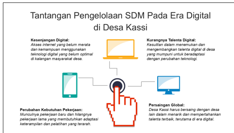
Gambar 1. Tantangan pengelolaan SDM pada era digital

Berdasarkan observasi yang dilakukan oleh tim pengabdian, disimpulkan bahwa: 1) Terjadi kesenjangan digital berupa akses internet yang belum merata dan kemampuan menggunakan teknologi digital belum optimal; 2) Kurangnya telenta digital, belum ditemukannya telenta digital yang mumpuni untuk beradaptasi dengan perubahan teknologi; 3) Perubahan kebutuhan pekerjaan membutuhkan adaptasi keterampilan dan pelatihan yang terarah; dan 4) Persaingan global, desa Kassi harus bersaing dengan daerah lain dalam meningkatkan telenta sumber daya manusianya di era digital.