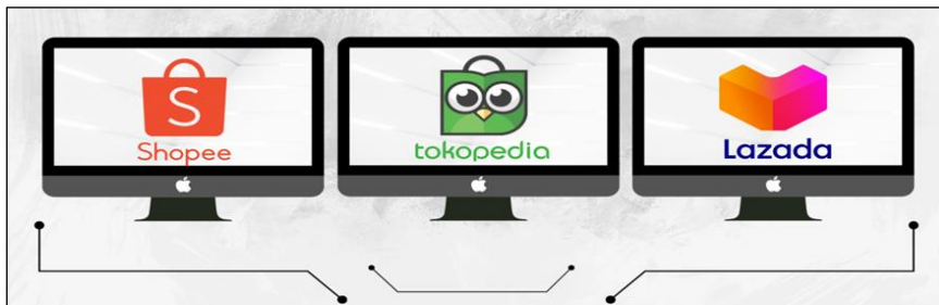
Gambar 3. Aplikasi e commerce atau tempat belanja online produk

Selain hal tersebut dalam proses pelatihan juga diajarkan terkait pemanfaatan aplikasi e-commerce sebagai pendukung dalam stok persediaan barang untuk usaha ataupun perbandingan harga.