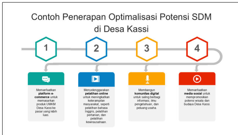
Gambar 5. Penerapan optimalisasi potensi SDM di Desa Kassai

Tim pengabdian juga menjelaskan terkait penerapan optimalisasi potensi SDM di Desa Kassai, agar dapat menjadi motivasi/pendorong bagi Masyarakat untuk mengembangkan potensi usaha di lingkungannya