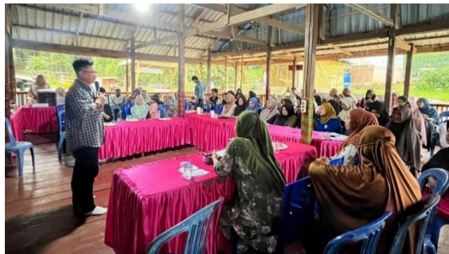
Gambar 6. Pemaparan materi oleh Tim Pengabdian

Proses pelatihan berlangsung dengan lancar karena antusias yang luar biasa dari peserta dan juga warga masyarakat lainnya. Suksesnya kegiatan ini juga tidak lepas dari bantuan kepala desa yang sangat mendukung dilaksanakannya pelatihan ini. Dengan kerja sama yang baik antara tim pengabdian, peserta pelatihan, dan dukungan dari kepala desa maka pelatihan berjalan dengan sukses, tim bisa menjalankan tugasnya memberikan pelatihan, dan bagi para peserta pelatihan mendapatkan penambahan ketrampilan berwirausaha. Hal ini sangat berguna bagi masyarakat Desa Kassai di masa yang akan datang.