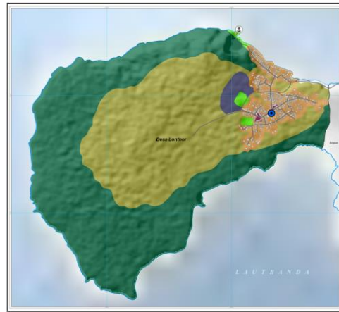
Gambar 3. Penggunaan Lahan Desa Lonthor

di kuasai Kolonialisme Belanda sehingga hutan di Desa Lonthor dijadikan sebagai hutan adat. Kawasan yang telah dibangun menjadi pemukiman diperuntukan untuk melakukan kegiatan sehari-hari bagi masyarakat seperti hunian, perdagangan skala kecil, pendidikan dasar, dan hubungan sosial masyarakat. Kawasan pemukiman yang telah dibangun memiliki luasan area sekitar \pm 28,16 Ha, luasan ini telah ada sejak jaman leluhur dimana masyarakat hanya melakukan pembangunan dan kegiatan pada kawasan tersebut saja.