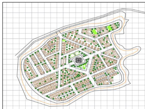
Gambar 4. Site Plan Kawasan Pemukiman Baru

Redevelopment permukiman yang akan direncanakan di desa ini dalam bentuk obyek rancangan yang berupa bangunan Homestay atau rumah warga yang disewakan untuk para pengunjung. Bentuk bangunan hunian akan berbentuk vertikal yang tetap mempertahankan karakter khas desa, baik secara fisik maupun non fisik. Dengan mempertahankan karakter-karakter dari Desa Lonthor, diharapkan perencanaan ini mampu menempatkan kembali penghuni asli tanpa merubah perilaku sosial dan gaya hidup yang lama.